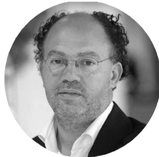
KILIAN WAWOE (НІДЕРЛАНДИ)

Професор лідерства та міжнародного управління персоналом Бірмінгемської бізнес-школи (Великобританія), лектор в Південно-східноєвропейському дослідному центрі (SEERC) і доцент в дослідницькій групі GNOSIS в школі управління при університеті Ліверпуля.